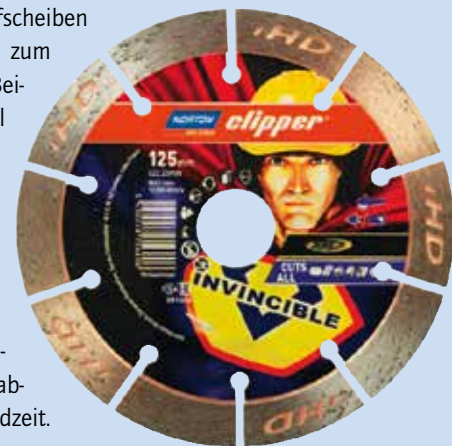
Praktisch: Mit der Scheibe Mr. Invincible lassen sich auf der Baustelle sowohl Stahl wie auch Beton schneiden.

Die neuen Norton Fiberschleifscheiben BlazeX F970 wurden speziell zum Schleifen, Entgraten und Beis Schleifen von Kohlenstoffstahl sowie anderen „weichen“ Metallen entwickelt. Die mikrokristalline Struktur des verwendeten Schleifkorns bietet im Vergleich zu Scheiben mit einer Mischung aus Keramik- und Aluminiumoxidkorn einen höheren Materialabtrag und eine längere Standzeit. Die Quantum3-Schruppscheiben stehen für einen schnellen und hohen Materialabtrag bei besserer Kontrolle und geringerem Anpressdruck. Dies bedeutet für den Anwender geringere Ermüdung sowie Vibrationsbelastung. Light Comfort Grinding (LCG) kommt für „leichte“ Schrupparbeiten mit akkubetriebenen Winkelschleifern zum Einsatz. Beispiele sind die zwei Hochleistungswerkzeug-Reihen Norton Quantum3 LCG für Metall sowie die Norton LCG-Multi-Material-Scheibe zum Schruppen von dünnem Stahl, Stein, Kupfer, PVC und Aluminium. Mit den Norton Clipper-Diamantscheiben Mr. Invincible lassen sich auf der Baustelle Metall wie auch Beton bearbeiten und schneiden.