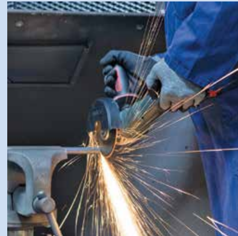
Die 0,6 mm dünne Trennscheibe XTK6 von Rhodium ist für Akku-Winkelschleifer besonders gut geeignet.