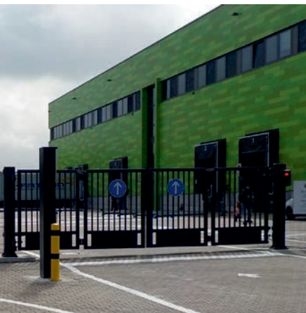
Schnelllauf-Falttor Quattro Eco.

Toranlagen-Spezialist Balu hat mit dem Quattro Eco Schnelllauf-Falttor eine Lösung für den industriellen Dauerbetrieb konzipiert. Die Toranlagen sind mit Antrieben und Frequenzumrichtern auf bis zu 100 % Einschaltdauer ausgelegt. Die eingesetzte Schubstangentechnik, zum Zusammenklappen der Torflügelsegmente, wird seit vielen Jahren im intensiven Dauer-