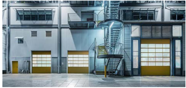
Der Hersteller aus Verl bietet Beschläge für alle baulichen Gegebenheiten.

Teckentrup Industrietore überzeugen dank extremer Robustheit und zuverlässiger Funktion. Je nach Anforderung kommen meist Rolltore oder Industrie-Sektionaltore zum Einsatz, die sich senkrecht nach oben öffnen und somit wenig Platz vor oder hinter der Einfahrt benötigen. Falttore benötigen mehr Platz, können aber bis zu extremen Breiten von 16 m gebaut werden. Feuerschutz-Schiebetore dienen im Innenbereich von Hallen der Trennung von Brandabschnitten. Der Hersteller sichert langlebige Funktionen zu, auch wenn die Tore in komplexe Produktions- oder Logistikprozesse eingebunden sind. Selbstverständlich erfüllen die Tore alle Sicherheitsanforderungen und die Vorgaben der EN 13241-1. Darüber hinaus zeichnen sie sich durch eine nutzerfreundliche Bedienung aus und bieten Industrietor-Beschläge für alle baulichen Gegebenheiten: Hoher oder niedriger Sturz, Flach- oder Schrägdach – die Beschlagsysteme sind so variabel wie die baulichen Anforderungen vor Ort.