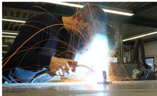
Inovator ist Fachhändler mit Metallbauwerkstatt.