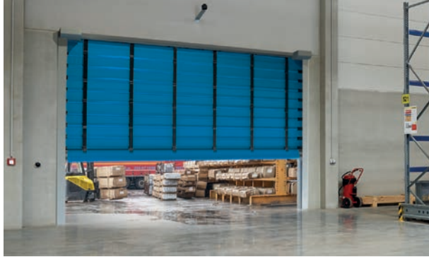
Das Faltschnellauf Tor vom Typ F 6010 ist ein Außentor für Öffnungen von bis zu 6 x 6 m.

Hörmann hat sein Industrietor-Programm um flexible Faltschnellauf Tore ergänzt, bei denen der Behang nicht aufgerollt, sondern gefaltet wird. Die einzelnen Segmente der Behänge sind mit robusten Windsicherungsprofilen aus verzinktem Stahl ausgerüstet. Hohe Öffnungs- und Schließgeschwindigkeiten beschleunigen die Arbeitsabläufe und minimieren Wärmeverluste und Zugluft. Zur Wahl stehen drei Tortypen für den Außen- und Innenbereich. Geöffnet und geschlossen werden sie über zwei Zurrgurte, die im Falle einer Beschädigung durch zwei weitere Gurte gesichert werden. Durch dieses patentierte System wird ein Absturz des Tores praktisch verhindert. Das Faltschnellauf Tor vom Typ F 6010 ist ein Außentor für Öffnungen von bis zu 6 x 6 m und ein Temperaturbereich von +5 bis +40 °C. Optionale Fensterelemente im Behang sorgen für Durchblick und Lichteinfall. Der Typ F 6010 Iso mit verbesserter Wärmedämmung öffnet mit einer Geschwindigkeit von bis zu 1,0 m/s und schließt mit 0,5 m/s. Das in den Seitenteilen integrierte Sicherheits-Lichtgitter überwacht dabei die Schließebene des Behangs bis zu einer Höhe von 2.500 mm. Das Faltschnellauf Tor F 14005 eignet sich ebenfalls für einen