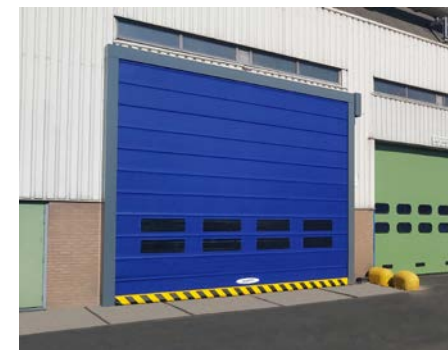
Neues Falttor mit einer Öffnungsgeschwindigkeit von 1,5 - 2 m/s.

Logistiker suchen vor allem bei Verladesituationen nach Optimierungspotenzial. Die Entwicklungsabteilung von Novoform hat die Anforderungen für Industrietore europaweit analysiert und möchte mit dem neuen NovoFold diesen Ansprüchen an Schnelligkeit, Arbeitssicherheit, Vielfalt, Montage- und Wartungsfreundlichkeit sowie Design nachkommen. Das neue Falttor NovoFold verwendet Gurte zum Öffnen und Schließen der Toranlage und besteht aus einem PVC-Behang (900 g/m 2 ), der in neun Farben verfügbar ist. Lichtgitter zur Erhöhung der Arbeitssicherheit sind Standard. Es ist mit Windversteifungen aus Stahl in speziellen Taschen ausgestattet, die der Toranlage eine besonders gute Windbeständigkeit geben. Dadurch ist es möglich, eine Windlast bis Klasse 5 zu erreichen. Dazu trägt die Öffnungsgeschwindigkeit von 1,5 - 2,0 m/s bei.