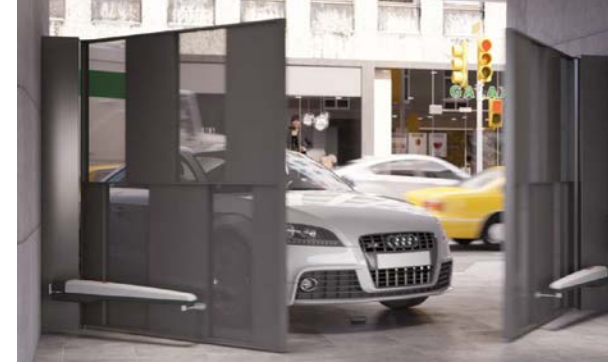
Nice-Hi-Speed für noch schnellere Dreh- und Schiebetore.