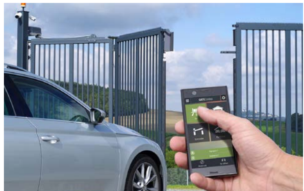
An das Tor lassen sich zwei Kameras installieren, die Bildanzeige lässt sich via Smartphone-App abrufen.

Die Schnelllauf-Falttore sind so konzipiert, dass sie eine Frequenzumsetzung bis zu 600 Zyklen am Tag ermöglichen, und Öffnungs- und Schließgeschwindigkeiten von bis zu 1 m/sec. Zudem sind sie sehr platzsparend. Komplettiert mit einer Kennzeichenerkennungskamera arbeitet das Tor autark und verifiziert zuverlässig berechnete Kraftfahrzeuge. Das System erfasst das Kennzeichen automatisch in Echtzeit und ergreift dann geeignete Maßnahmen wie das Öffnen eines Tores oder das Generieren eines Alarms. Das Tor lässt sich über ein GSM-Modul steuern und wird so per Anruf oder App bedient. Das GSM-Modul Gate Control Pro besitzt die ONVIF Kamera-Unterstützung mit Bildanzeige in der Smartphone-App. Es können bis zu zwei Kameras eingebunden werden. Besucher, Lieferanten oder Mitarbeiter melden sich über Sprechanlagen oder verifizieren sich über Zugangskontrollsysteme. Die Anlagen erfüllen Anforderungen vom Bluetooth/NFC-Modul bis zum Fingerprint-Reader.