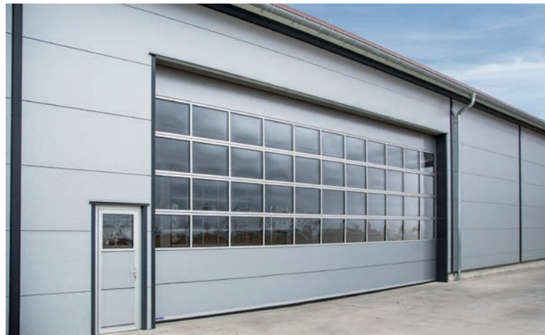
Die Produktreihe S4000 wird bis zu einer Breite von 12 m angeboten.

Mit der Produktreihe S4000 bietet Bäurle Tore und Elementbau Sektionaltore bis zu einer Breite von 12 m an. Der Hersteller aus Nördlingen produziert die Paneele für Sektionaltore auf einer hauseigenen Paneelpresse. Die Stabilität der 53 mm starken Paneele wird durch zwei stranggepresste Aluminium Profile erreicht, die oben und unten fest in das Paneel eingeschäumt werden. Die hochwertigen Zargen und Laufschiene sind aus Aluminium. Das Torblatt wird über kugelgelagerte Tandemlaufrollen sicher geführt und schließt besonders dicht an der Zarge ab. „Als mittelständischer Hersteller von Sektionaltor, Roll-, und Werkeinfahrtstoren sind Sonderlösungen, individuelle Anpassung an bauliche Gegebenheiten und ausgefallene Kundenwünsche unser Tagesgeschäft“, meint Holger Kretzschmar, Vertriebsleiter. Nach Kundenwunsch werden Sektionaltore mit hoher Laufgeschwindigkeit oder mit Schallschutz angeboten.