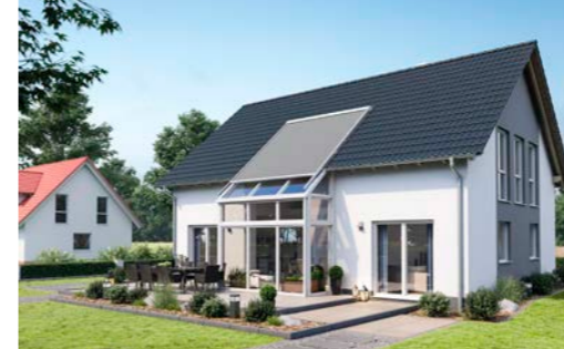
Die Wintergartenmarkise W550 mit Zip bietet Beschattung für große Wintergärten.

Tageslicht wirkt sich positiv auf die Lernumgebung aus, kann aber auch stören, wenn in den Klassen etwa mit visuellen Medien gearbeitet wird. Bei der Planung des Sonnenschutzes sollte man darauf achten.