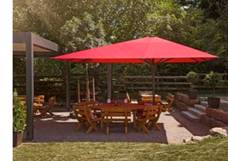
Der Sonnenschirm Caravita: An der Hädefelder-Schoppen-Scheune in Marktheidenfeld.