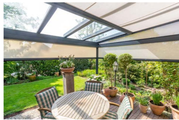
Das Programm der Erwilo Zip-Senkrechtmarkisen besteht aus fünf Kastengrößen mit eckiger und halbrunder Form.