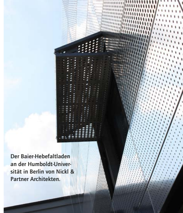
Der Baier-Hebefaltladen an der Humboldt-Universität in Berlin von Nickl & Partner Architekten.