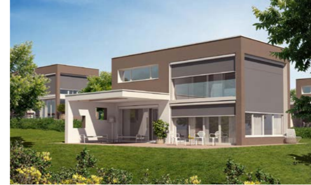
Kaum sichtbare Führungsschienen mit innenliegender Tuchführung halten die Ventosol Senkrechtmarkisen in Spannung.