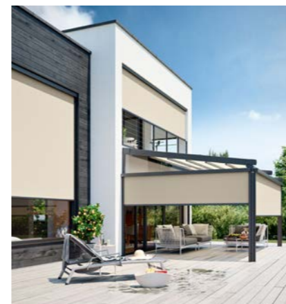
Die Senkrecht-Markise VertiTex II lässt sich an Fenstern, Terrassendächern, Balkonen und Wintergärten einsetzen.

Die Senkrecht-Markise VertiTex II hat eine Kassette von nur 75 mm Höhe und ermöglicht Tuchbreiten von bis zu sechs Metern. Eine freitragende Kastenbefestigung ohne Konsole, also nur per Führungsschiene, ist bei Längen bis zu 2,5 Metern möglich, wodurch sie auch in kleinen Nischen einsetzbar ist. Damit bietet sich das Produkt insbesondere für den Markisen-Austausch oder die Nachrüstung an. Die Markise lässt sich per Funk steuern, eine kabelgebundene Variante gibt es aber auch. Zur Führung des Tuchs stehen eine Zip-, Seil- und Schienen-Variante zur Auswahl.