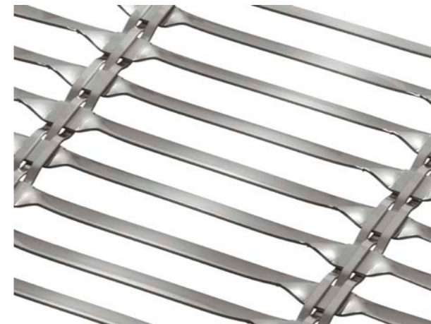
Das Haver Architekturgewebe Largo-Twist ist speziell für den Sonnenschutz entwickelt worden.