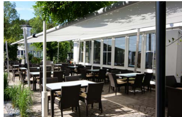
Das Twister-Segel Shadeone zeichnet sich laut Hersteller durch eine einfache Bedienung und Montage aus.