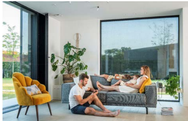
Sonnenschutz und Nachtauskühlung bewirken angenehme Innentemperaturen.