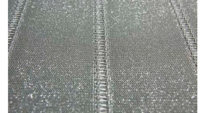
Einige Dessins des Markisengewebes perfotex von Markilux eignen sich besonders gut als Sonnenschutz Tuch für Wintergärten.