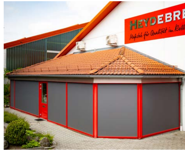
Hey-Zip ist ein Textilscreen-System, das unter anderem vor dem Fenster oder freistehend z.B. für Pergolas verwendet werden kann.