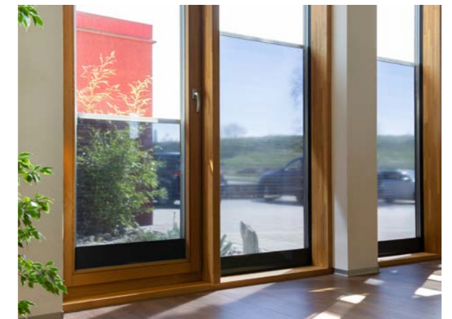
Bei einer Produktvariante des Iso-Roll schließt das Rollo von unten nach oben.