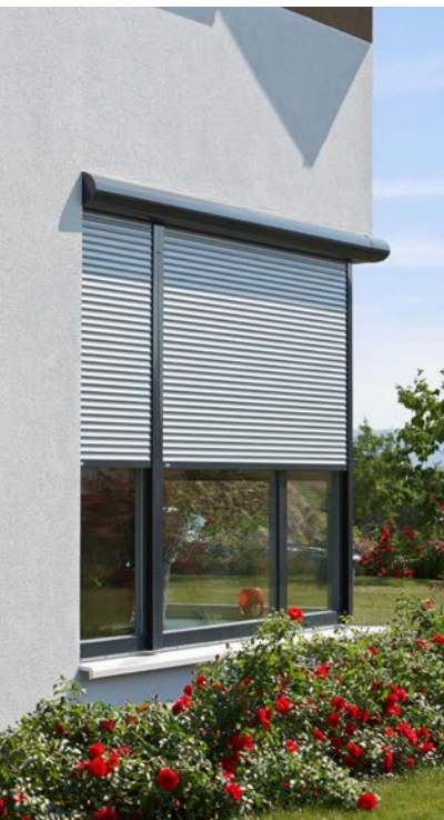
Die maßgeschneiderten Aluminiumrollläden von Alulux eignen sich für Modernisierung und Neubau.

Wichtig bei der Wahl des Sonnenschutzes ist es, aus der Vielzahl der Produkte genau das auszuwählen, das den persönlichen Anforderungen und den Gegebenheiten des Hauses oder der Wohnung entspricht. Eine Möglichkeit sind beispielsweise maßgeschneiderte Rollladensysteme aus Aluminium von Alulux. Geeignet für Modernisierung und Neubau, minimieren sie Wärmeverluste und reduzieren Heizkosten, bieten Schutz und verbessern das Raumklima auch im Sommer. Verfügbar sind sie als Vorbaurollläden oder Aufsatzsysteme. Weitere Sonnenschutzlösungen des Herstellers sind die Artec Aluminium Raffstores und der Textilscreen SolidScreen. Für die richtige System-Auswahl, die fachmännische Planung und den Einbau sorgt der Fachpartner, der über die Service-Seite des Hersteller-Portals zu finden ist.